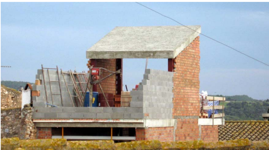
Obra del carrer Jacint Verdaguer 18 de Bellvei Vista de la construcció d'una quarta planta suposadament fora de normativa.

També, dins del mateix barri, la reclamació feta per l'Entesa sobre les obres il·legals